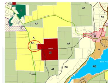
Plan d'affectation du sol comme adopté