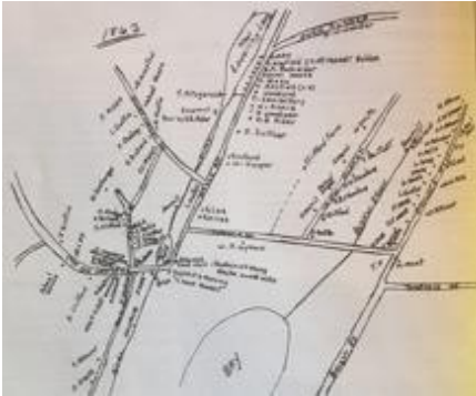
Carte du Canton, 1863

Les premiers colons arrivant dans la région à la fin du 18 e siècle s'installèrent sous le développement de canton, commun de la région et de l'époque. Les accès aux voies navigables, par Georgeville et son traversier, et terrestres, par Fitch Bay et le pont Narrow reliant Montréal à Boston firent du village un lieu privilégié pour la foresterie avec l'opération de cinq moulins. En plus du pont Narrow, un autre pont couvert traversait le ruisseau reliant le lac Lovering à la Baie Fitch.