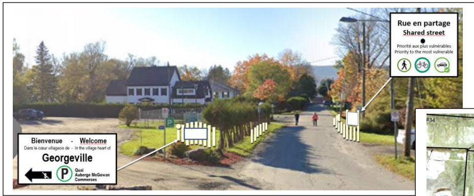
Projet présenté le 19 juin 2023

meilleur partage du domaine public en faveur du piéton better sharing of the street in favor of pedestrians